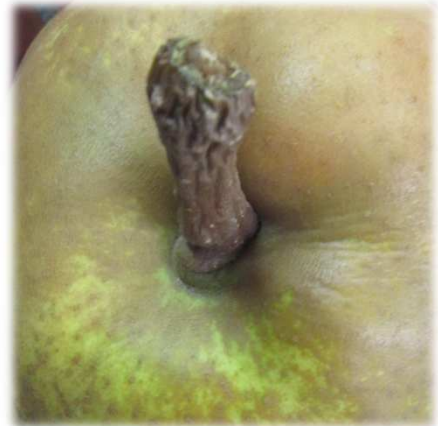
皺紋出現在軸周圍。